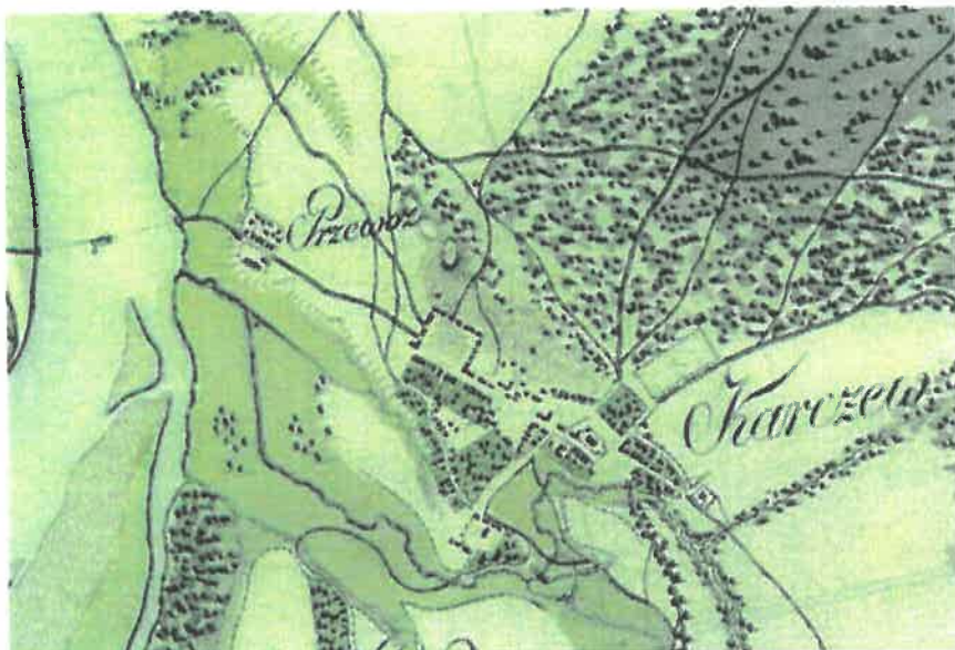
Mapa Galicji Zachodniej 1804 r.