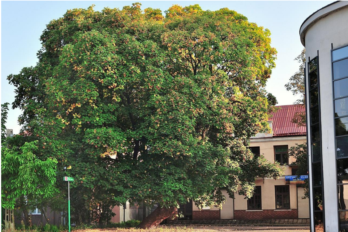
Fotografia przedstawiająca drzewo